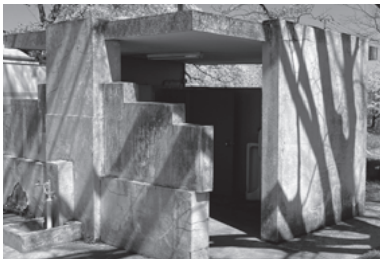
改修前の男女共用トイレ