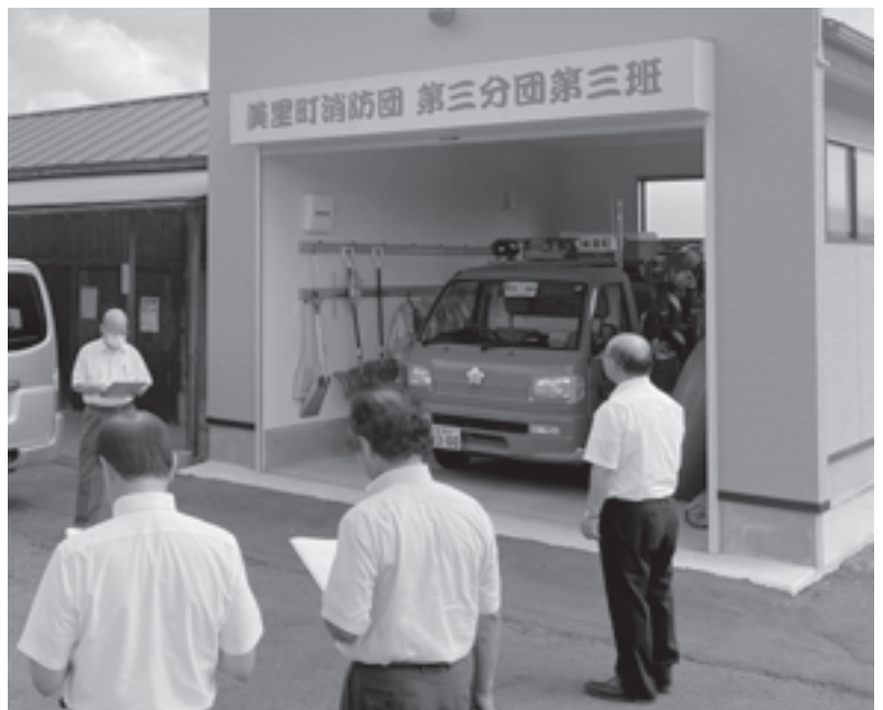
現地調査（新築された平針地区ポンプ小屋）