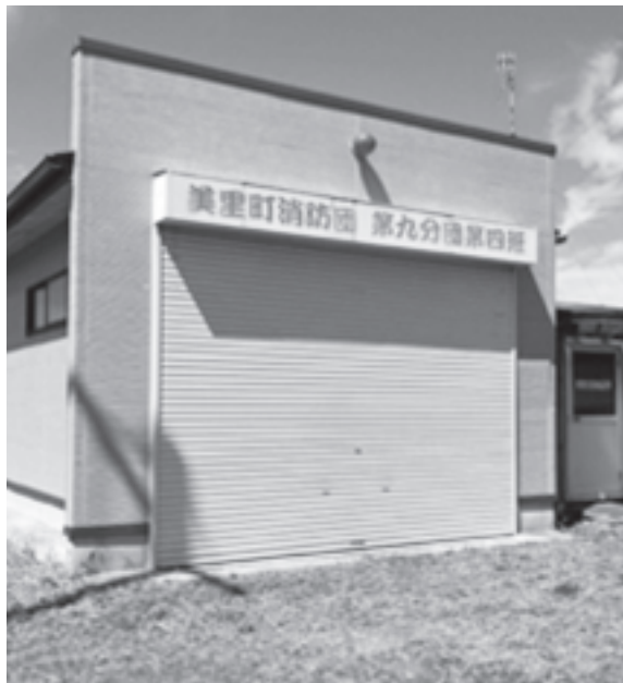
舗装の要望があるポンプ小屋

問 本町消防団のポンプ車など消防設備は合併時に整備され、かなりの年数が経過しているが、更新についてどう考えているか。 町長 国や県、各種団体からの交付金や補助金の活用、日本消防協会などからの消防車両の寄贈などによって順次更新を行っていく考えである。 問 消防ポンプ車の車庫入口を舗装してほしいとの声が上がっているが対応する考えは。