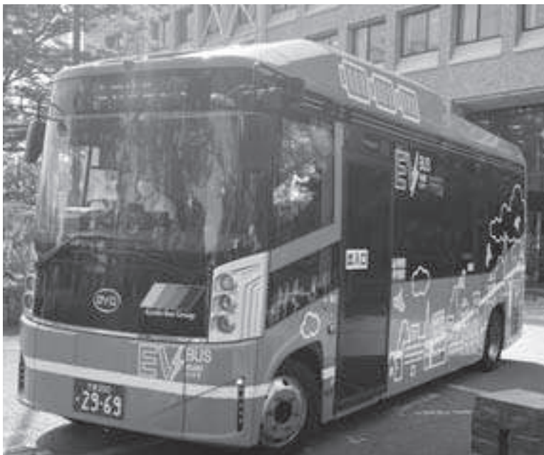
電気自動車の市内循環バス

公共交通の充実、高齢化社会の進展への対応でもあり、誰もが健康で安全、安心を重視したまちづくりをすることは本町の重点課題と考えるので、久喜市の取り組みを参考に町への提言を取りまとめたいと考えます。