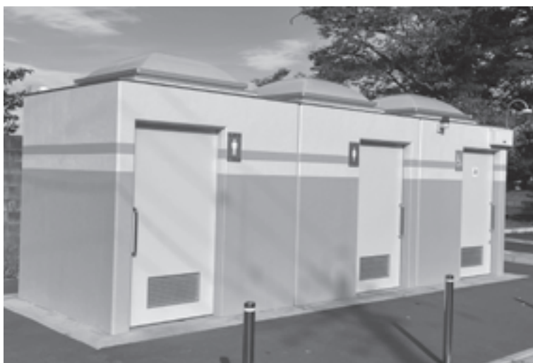
新しいトイレでみんなが使いやすく

4年度で小牛田公園整備は完了しました。事業費は公園施設改修等工事請負費638万円です。