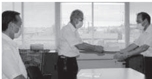
決算審査意見書を町長へ