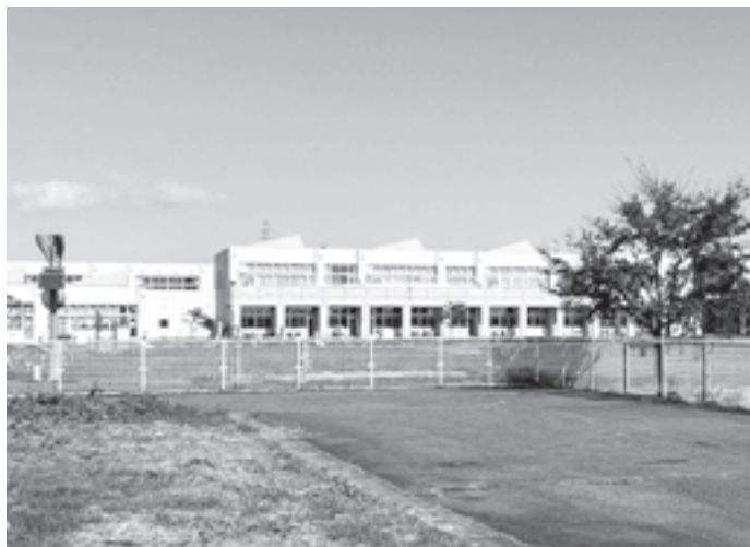
地域の方々との話し合いを

教育長 児童の推移をみると複式学級の検討が必要になる。統廃合についても教育委員会では検討していないが、今後必要になる。