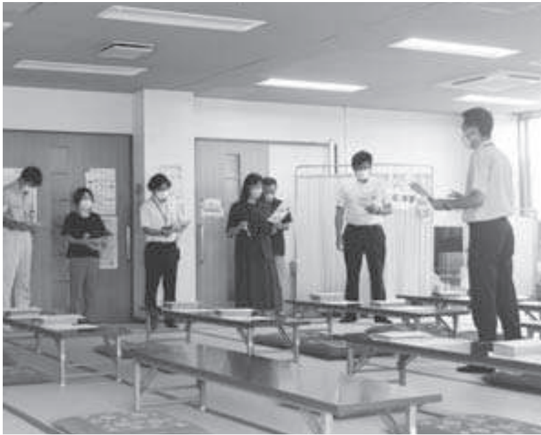
現地調査（抗菌畳になったさるびあ館）

放課後児童指導員の確保や各放課後児童クラブへの正職員配置を図り、安全・安心に努められるよう意見とした。