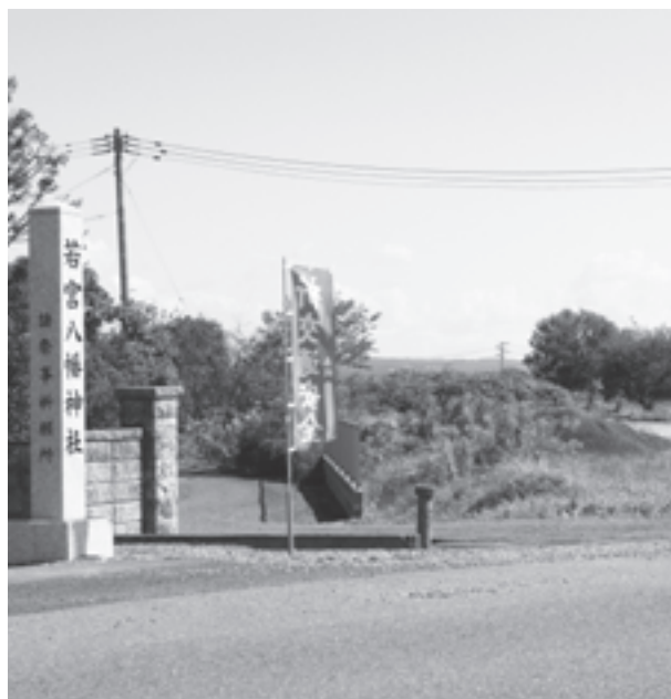
早期着工が望まれる道路予定地

問 県道鹿島台高清水線と国道108号小牛田バイパスを直結する仮称「牛飼バイパス」の整備について、今後の見通しは。