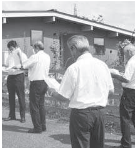
現地調査（食と森のこども園美里）

子ども家庭総合支援拠点事業は、子どもとその家庭、妊婦の方々を総合的に支援しており、関連団体と連携し十分な成果を上げることが確認できた。