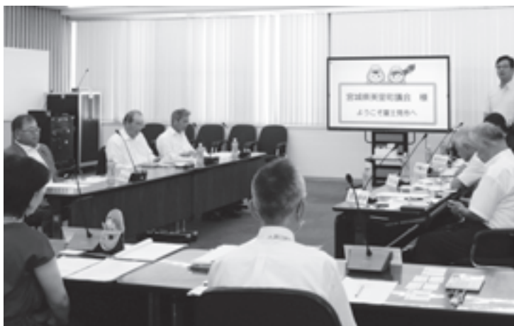
富士見市の取り組みを視察

美里町としても専門職を配置し、民間との情報交換や意思疎通を通じ「気づき」「つなぐ」「連携して支援する」体制の構築が望まれる。