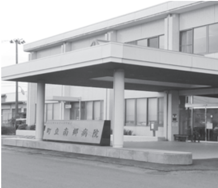
地域医療のかなめ南郷病院

9月会議が9月5日から19日まで開かれました。一般質問では3人が8項目を質問、議案の審議では条例改正や補正予算、4年度決算認定など16議案を原案どおり可決しました。