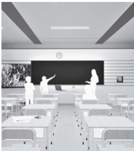
少人数指導で基礎学力の向上を