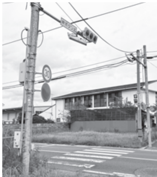
通学路の安全確保を