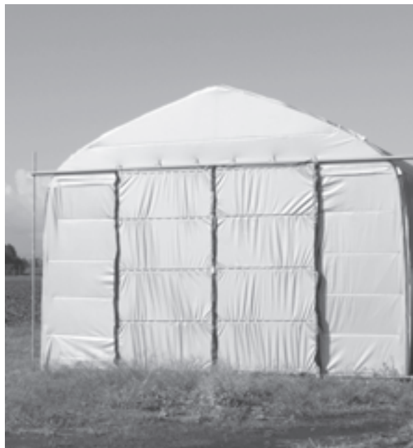
廃棄物が保管されたハウス