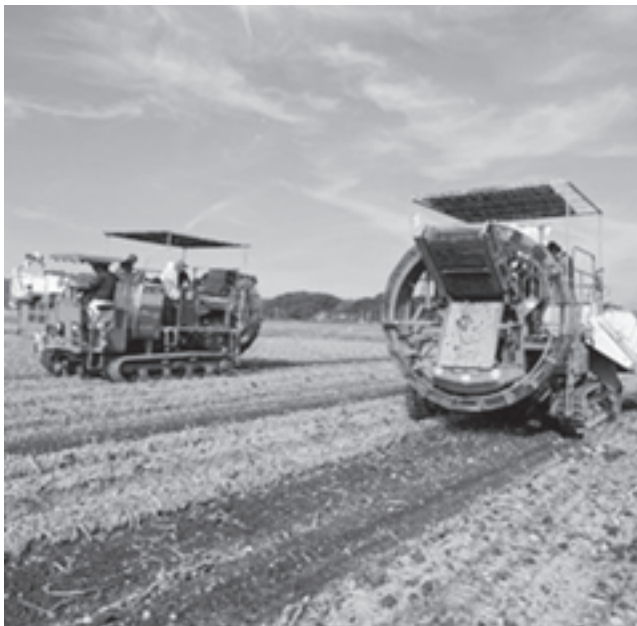
ジャガイモの収穫作業

利用総額は今年度末で3億4820万円の見込みで、今後の活用については南郷庁舎周辺の公共施設リニューアルと若者定住対策、子育て環境の整備に活用していく。