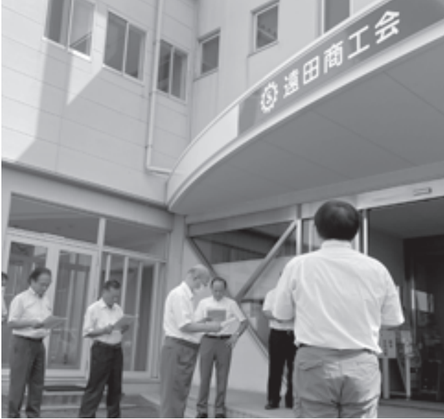
現地調査（改修により移転した商工会）

美里町起業サポートセンターKiribiを活用し、テレワーク環境の整備を図り、在宅勤務場所の提供及びサテライトオフィスとしての活用など、コロナ禍における柔軟な働き方を促進するとともに、コロナ禍において中小企業に対し支援金の交付、消費購買活動が大きく低迷していることからプレミアム付き商品券の発行の支援をし、消