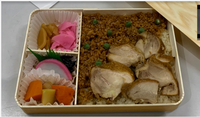
復刻版小牛田の「復刻とりめし」

高校生と地域の鉄道への思いが込められた“小牛田の味”が、全国へ羽ばたくこの機会に、ぜひご賞味ください。