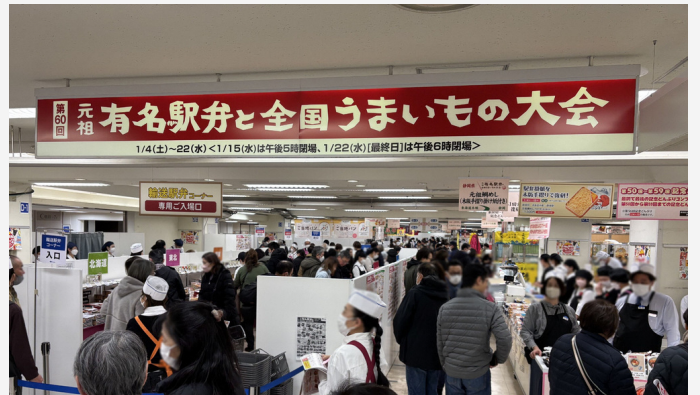
昨年開催「第60回元祖有名駅弁と全国うまいもの大会」の様子