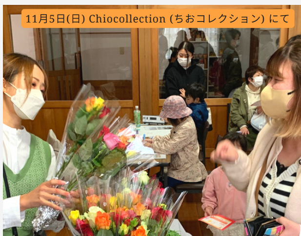
11月5日(日) Chiocollection (ちおコレクション) にて

地域おこし協力隊それぞれの活動を紹介するコーナー。 今後の企画の告知なども含まれているので、ぜひチェックをお願いします！