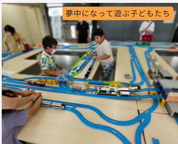
夢中になって遊ぶ子どもたち