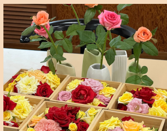
町花バラを町内外へたくさんPRしました (武田)