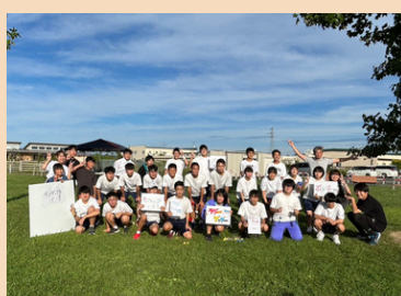
中学生とイベント運営楽しかった！ (桜井)