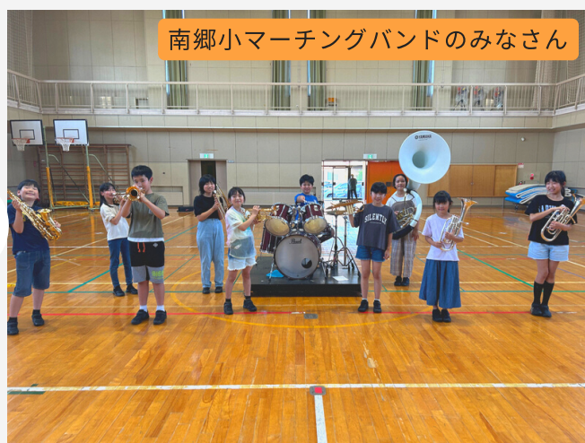
南郷小マーチングバンドのみなさん