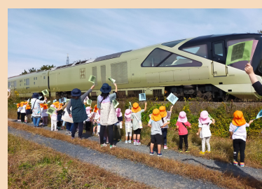
四季島にこごた幼稚園児たちと手を振りました