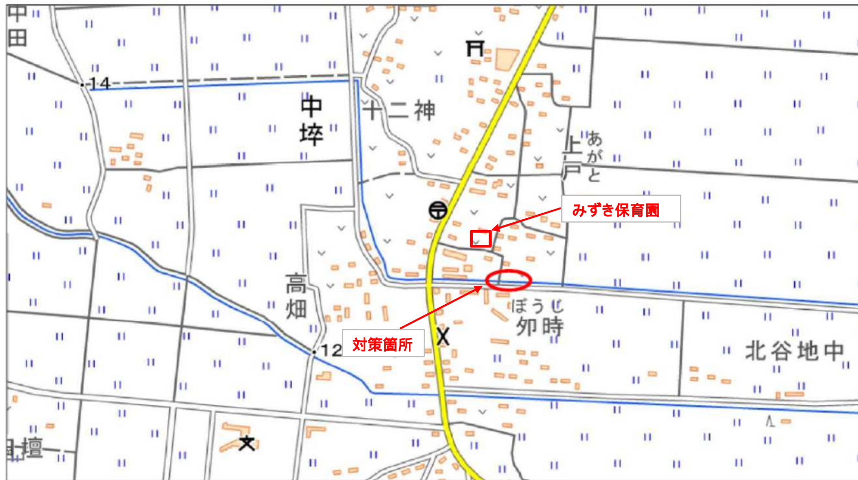
位置図 箇所番号27 - 12