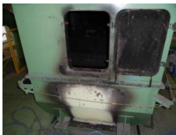
ベルトコンベア上部