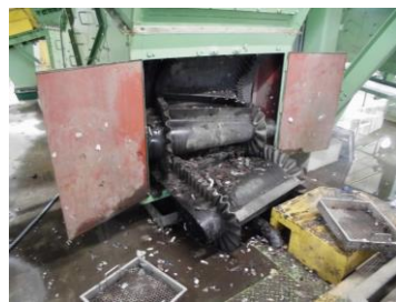
焼損・脱落したベルト

リチウムイオン電池 は、充電して使用できる製品の多くに使われており、強い衝撃や圧力が加わることで発火します。