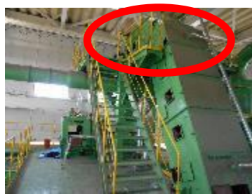
焼損したベルトコンベア

令和5年7月7日、大崎広域リサイクルセンターで火災が発生し、ベルトコンベアの一部が焼損しました。発火当時、不燃ごみを細かく砕く作業をしており、リチウムイオン電池が原因と思われます。