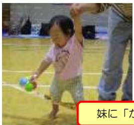
妹に「がんばれ～！」と応援