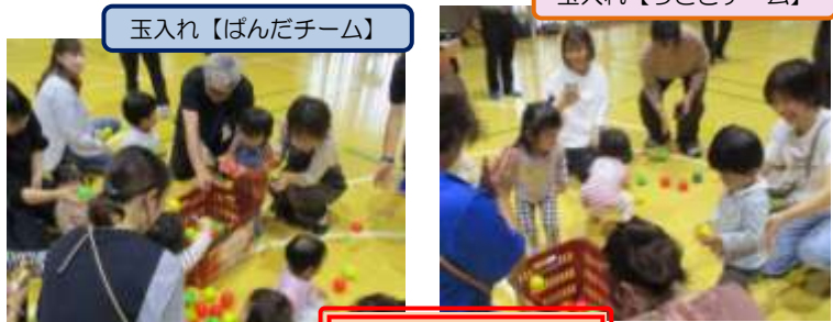
玉入れ【ばんだチーム】