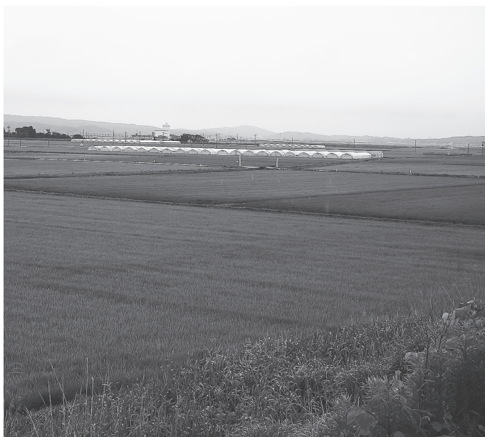
登録認定が期待される大崎耕土

町長 大崎地域で日本農業遺産に申請した部分には特に「巧みな水管理」ということで、長年にわたる洪水や渇水、鳴瀬川と江合川に挟まれた地域で、ため池など多様な生物も