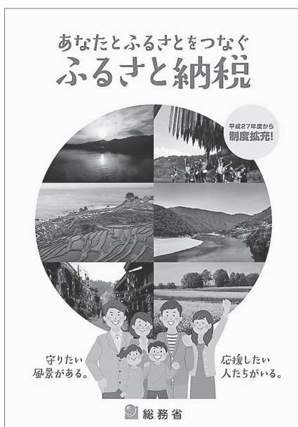
総務省ホームページより

町長 返礼品を返すのはお礼の気持ちで返すわけであって、これからはふるさと納税をしてくださいという意味合いのものではないと思っている。