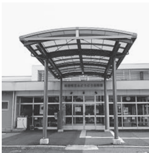
小牛田地域の幼稚園で給食が始まります