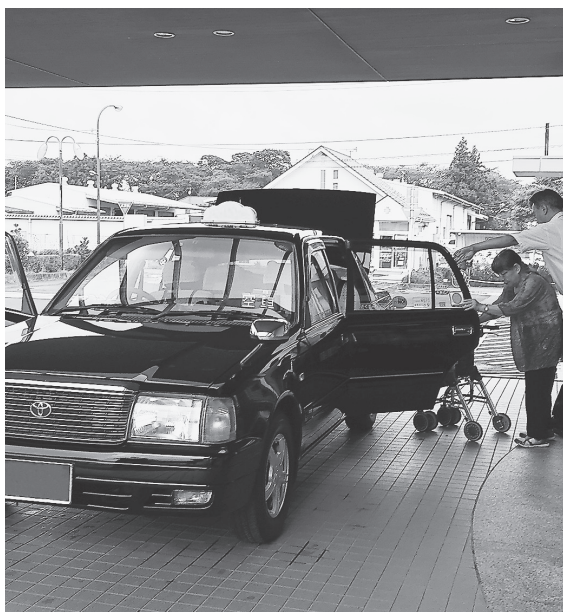
生活にかかせないデマンドタクシー

問 高齢者が運転免許証を自主返納する傾向が増加している。他自治体においては支援制度を設けて推進しているが、本町ではどうか。