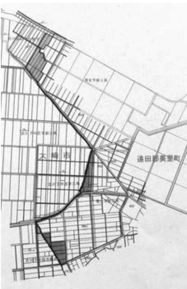
境界変更になる青生地区

答 境界変更した時点で旧字でも自治体が変わり、納付先が変わる。評価に差がある場合は大崎市と協議するが、評価替えの時にしか変更はできない。