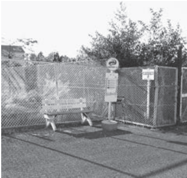
ヨークペニマル南のバス停留所