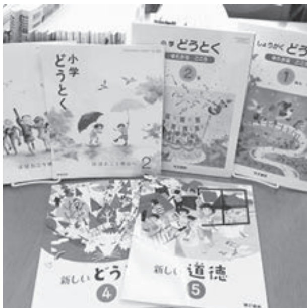
平成30年度から使用される「道徳」の本