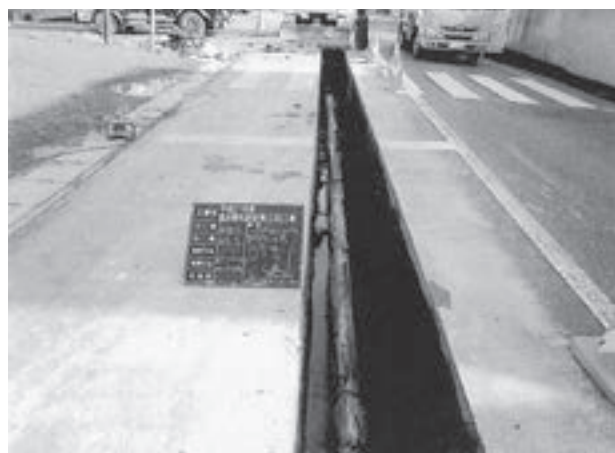
老朽管の布設替工事

漏水防止と耐震化を進めながら、29年度から38年度までの10年間で、毎年度約1億7,000万円の事業規模で整備完了に向け計画。