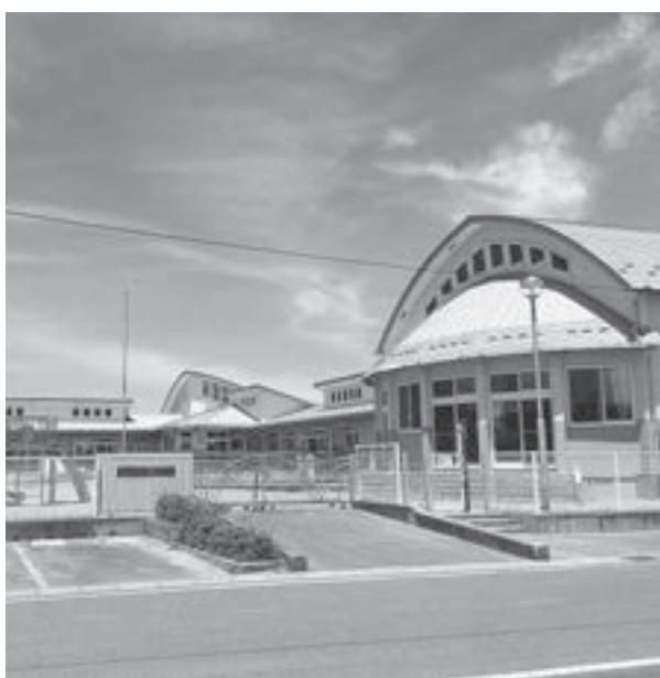
さらなる非常勤職員の待遇改善を

問 国は「今後調査し確認されたら指導する」と一歩踏み出したが、一方で交付税の算定を含め定員削減を進めている。国に対し財政の締め付けではなく地方財政を確立するよう主張すべき。 町長 議論されたことをしっかりと要望していく。