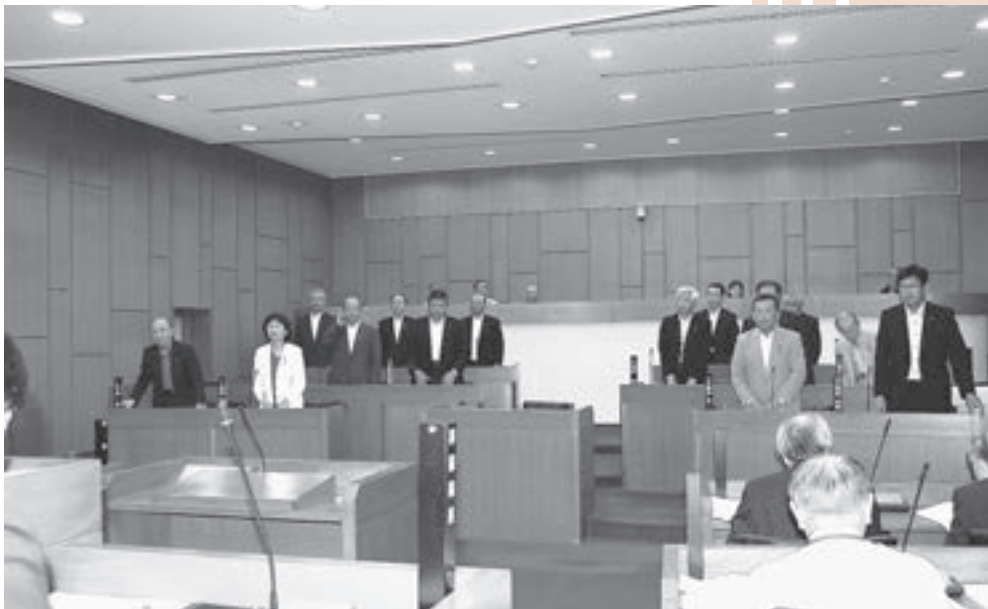
議案審議の採決のようす(6月14日)

6月13日と14日に一般質問が行われました。今回は5人の議員が、教育行政や水道事業、ふるさと納税など12項目にわたり町の方針を問いました。 6月会議の傍聴者は45人でした。 次回の一般質問は9月5日に行われます。