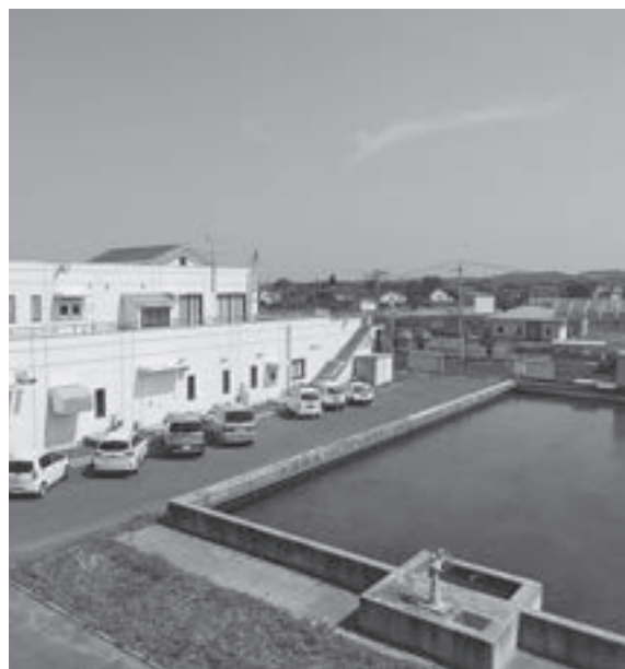
飲料水は生存権そのもの

問 水道法の一部を改正する法律案が国会に提出されたが内容は、 町長 官民連携の推進で、水道施設に関する公共施設など運営権を民間事業者に設定できる仕組みが導入される。