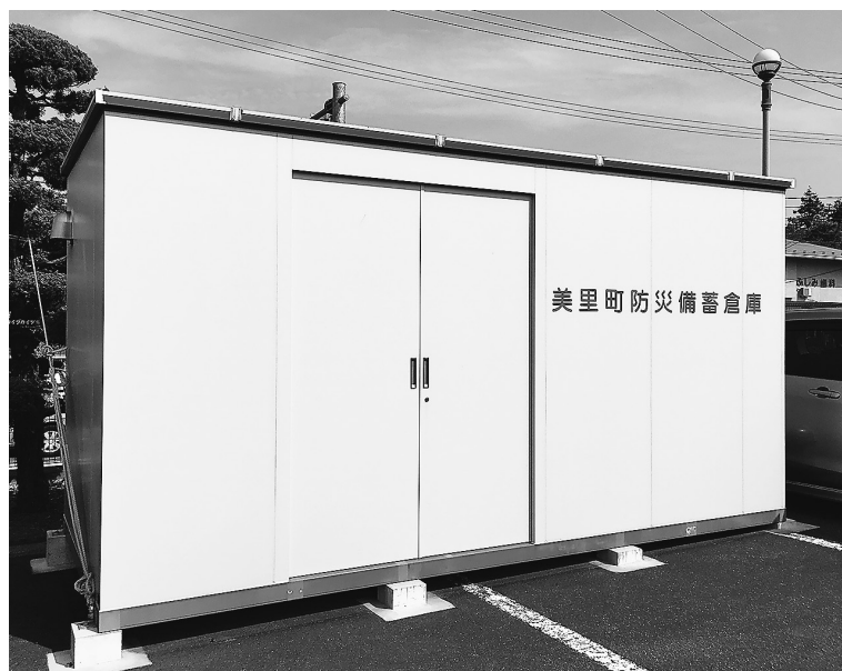
一時移設される防災備蓄倉庫

答 小牛田高等学園の敷地内にある防災倉庫が、体育館を解体、新築する工事の関係により、一時的に、校庭西側に移設するため、期間は31年3月までである。