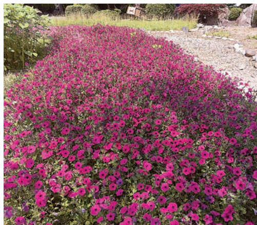
南郷高校のペチュニア

6月会議1日目の議会傍聴者数は本小牛田地区婦人会ほか36名で、入りきれない方は1階モニ