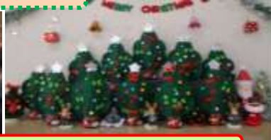
親子制作“フェルトでツリー”